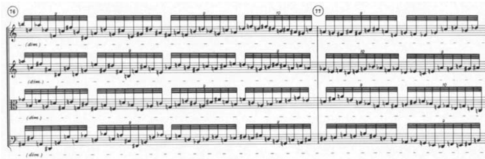
مثال ۶: لیگتی، کوارتت زهی شماره‌ی دو (۱۹۶۸)، موومان اول ۷۶ - ۷۷ mm:

مثال ۷ بخشی از کنسرتوی ویولنسل آهنگساز را نشان می‌دهد که در آن از گروه ویولن‌ها، ویولاها و ویولنسل‌ها برای ایجاد بافتی مغشوش و متراکم استفاده شده است. در اینجا آهنگساز در هر ضرب تقسیم‌های متفاوتی را برای هر ساز در نظر گرفته است. به عنوان مثال، در ضرب اول میزان ۲۵ تقسیم‌های ۴، ۵، ۶ و ۷ تایی در مقابل هم قرار گرفته‌اند و بطور همزمان شنیده می‌شوند. این عدم اتحاد ریتمیک بین لایه‌ها موجب پیچیدگی و جزئیات بیشتر در ترکیب می‌شود. در این مثال هر چهار ساز در رجیستر مشابهی به اجرای الگوها پرداخته‌اند و برای ایجاد صدایی با رنگ خاص آرشه را نزدیک به خرک مورد استفاده قرار می‌دهند: