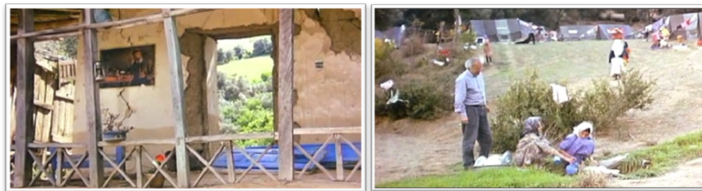
تصویر ۲- سمت راست: نمایی از امید و زندگی در دل مصیبت و بلا. سمت چپ: دور نمایی از امید و سعادت در دل خرابی و ویرانی. مأخذ: تصویر از قاب واقعی فیلم گرفته شده است.

زندگی و دیگر هیچ، دومین فیلم از سه‌گانه کوکر کیارستمی است که می‌توان گفت اتمسفر کاملاً متفاوتی نسبت به خانه دوست کجاست؟ دارد. این بار محوریت و موضوع فیلم در راستای یافتن شخصی شکل گرفته است که خود در فیلم اول در تلاش برای یافتن دوست و خانه او بود، ولی این بار خود غایب داستان بوده و تلاش در راستای یافتن و اطمینان از سلامت وی بعد از زلزله مهیب ۱۳۶۹ رودبار می‌باشد. در این فیلم نیز فضاهای روستایی و طبیعی فیلم در جاری‌سازی شاخص گردهم‌آوری معانی طبیعی، نقش مهمی دارد ولی این بار در یک قالب جدید که تم اصلی آن ویرانی است و در واقع معماری و محیط مصنوع ساخته شده بشر در طبیعت، به دست خود طبیعت ویران شده است، اما اینجاست که حس تعلق داشتن به مکان بیش از سایر فیلم‌های کیارستمی مشهود است. با اینکه ظرف زندگی از بین رفته است ولی خود زندگی و تعلق به مکان پابرجاست (تصویر ۲).