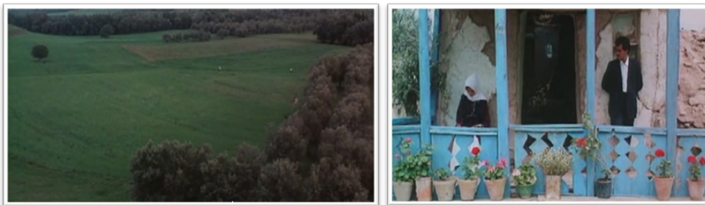
تصویر ۳- سمت راست: نمایی از فضای زندگی ساده و بی‌آلایش. سمت چپ: دورنمایی از رابطه طبیعت و انسان مأخذ: تصویر از قاب واقعی فیلم گرفته شده است.

این فیلم هم در فضایی روستایی و طبیعی شکل می‌گیرد، زمینه جاری شدن یکی از شاخص‌های این‌همانی که گردهم‌آوری معانی طبیعی است، به واسطه طبیعت روستایی کوکر فراهم می‌گردد. از حیث نمادینه‌سازی، همان‌طور که در انتخاب عنوان فیلم (زیتون نماد صلح و دوستی) نیز توجه شده است، در بسیاری از سکانس‌ها استفاده از نمادهای زندگی ساده و ایرانی مثل گل شمعدانی ملموس است. ایوان یا مهتابی به عنوان یکی از نمادهای معماری ایرانی، در ایجاد آشنایی با محیط خاص و احساس تعلق و وابستگی نقش مهمی دارد (تصویر ۳).