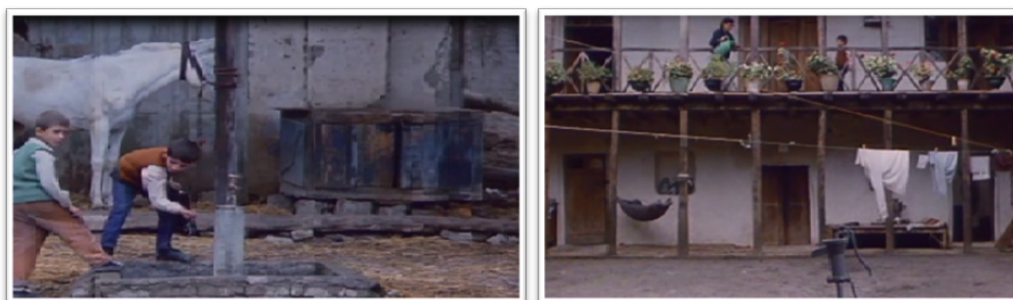
تصویر ۱- فضایی از حس مکان به واسطه فعالیت‌های روزمره.

حس تعلق می‌باشد در بسیاری از صحنه‌های فیلم مشهود است (تصویر ۱). در باب نمادینه‌سازی اثر، جاده ماریپیچ روی تپه، غلامگردش و شمعدانی‌های روی آن، پنجره‌های چوبی، رنگ درها و پنجره‌ها، و بازی با سایه و نور از موارد قابل مشاهده می‌باشد. مکان در خانه دوست کجاست؟ بر خلاف تلاش برای آشنایی زدایی و دور کردن مخاطب از خود، در نزدیک‌ترین فاصله ممکن با مخاطب خود قرار دارد؛ مکان نمایش داده شده در این فیلم نهایت هماهنگی و انطباق با طبیعت را دارد؛ مسیرها و گذرها در راستای شیب طبیعی زمین ساخته شده‌اند (مسیر زیگزاگ روی تپه و طولانی بودن آن)، فرم‌ها در بومی‌ترین حالت خود و منطبق با طبیعت شکل گرفته‌اند، جزئیات مکان از موتیف‌های فرمی گرفته تا نمادهای ایرانی (گل شمعدانی و ...) در تمامی سکانس‌ها قابل مشاهده است.