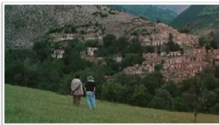
تصویر ۴- آرایش فضایی عمومی خانه‌ها و حس تعلق انسان

می‌شود. در سکانشی دیگر، مکان به عنوان یک کلیت به صورت دسته‌های متراکمی از خانه‌های گلی محصور را در شیب و دامنه تپه و همچون گروه منظمی از خانه‌های روستایی تجربه می‌کنیم. موقعیت، آرایش و انسجام هر چه متمایز مکان در تصویر مذکور، قابل مشاهده می‌باشد. خانه‌های منفرد، روستاها، حاصل ساختنی هستند که در درون و پیرامونشان میانگه‌هایی چندگانه را گرد هم می‌آورند. بناها زمین را همچون چشم‌انداز سکونت یافته به انسان نزدیک می‌کنند، و در همان حال صمیمیت کنار هم باشیدن را زیر پهنای آسمان جای می‌دهند (تصویر ۴).