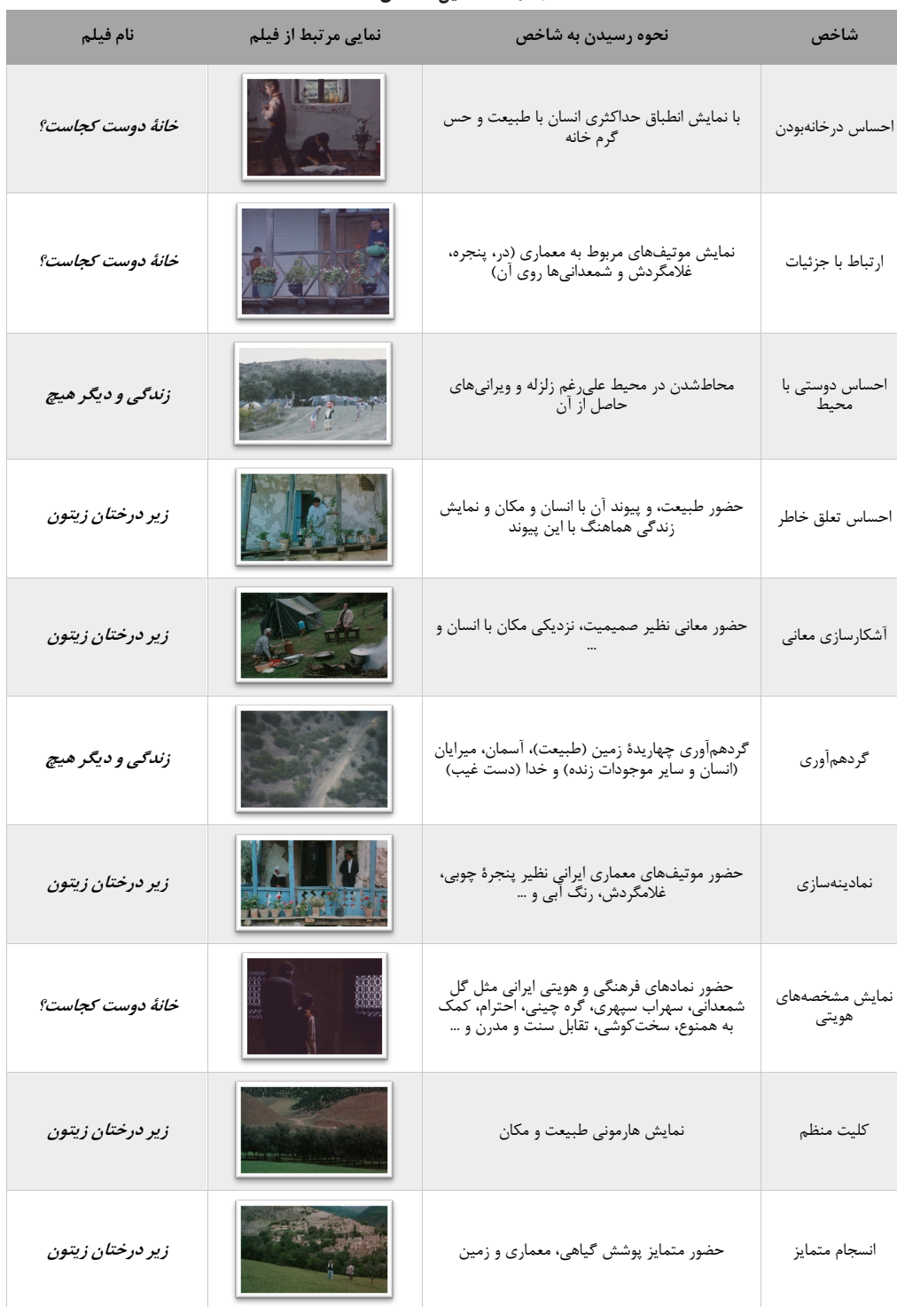
جدول ۱- تحلیل شاخص‌ها