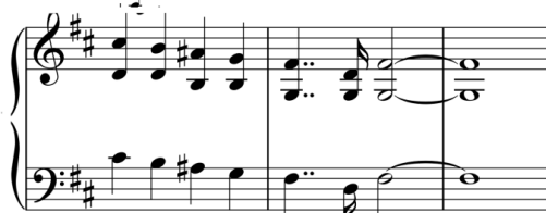
شکل ۱-ج) میزان‌های ۱-۷ قسمت مقدمه