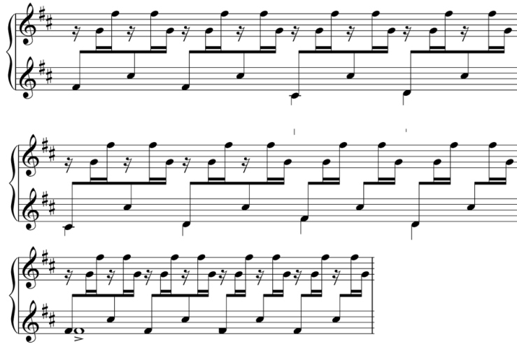
شکل ۶-ب) میزان‌های ۱۸-۲۱

علاوه بر موارد مذکور، حرکت بال‌های پروانه در این قطعه نیز عمدتاً نت سل را در قالب آرپژ مورد تأکید قرار می‌دهند. از جمله در آرپژگونه‌های میزان‌های ۱۶ تا ۲۱، که ملهم از ریتم چهارمضرب است، می‌توان رنگ آمیزی فاصله‌ی دیسونانس «دوم کوچک» یا همان نت شاخص سل بکار از چهارگاه را شاهد بود، که رنگ شرقی به ملودی می‌دهد (شکل ۶-ب).