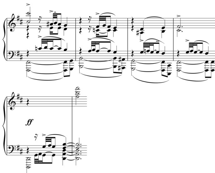
شکل ۴) میزان‌های ۱۲۵-۱۳۰، ابتدای تکرار واریاسیونی ملودی

میزان‌های ۱۱۰ تا ۱۲۳ واریاسیونی از میزان‌های ۶۲ تا ۷۶ هستند و همان سیر مُدال را دنبال می‌کنند. میزان‌های ۱۳۵ تا ۱۲۵ نیز تکرار واریاسیونی میزان‌های ۹۶ تا ۱۰۵ بوده که تشابه مدال با ارائه‌ی پیشین دارند؛ به هر حال این بار پس از خاتمه‌ی ملودی در «همایون فا دیز» در میزان ۱۲۹، با آمدن نت «سی» در باس، محوریت صوتی مجدداً روی «اصفهان سی» باز می‌گردد، تا شرایط برای تکرار قسمت A فراهم شود. شکل ۴ ابتدای تکرار واریاسیونی ملودی مذکور، یعنی میزان‌های ۱۲۵ تا ۱۳۰ را نشان می‌دهد.