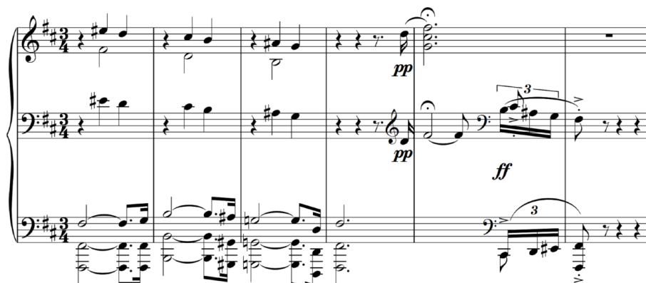
شکل ۵) کادانس پایانی قطعه-میزان‌های ۱۵۱-۱۵۶

قسمت کدا از میزان ۱۵۱ به تثبیت چهارگاه فا دیز می‌پردازد. می‌توان گفت بخش کدا تماماً در چهارگاه است و در کادانس پایانی که حالت پاساژگونه دارد، تتراکورد اول و دوم چهارگاه بر روی هم قرار گرفته‌اند (شکل ۵).