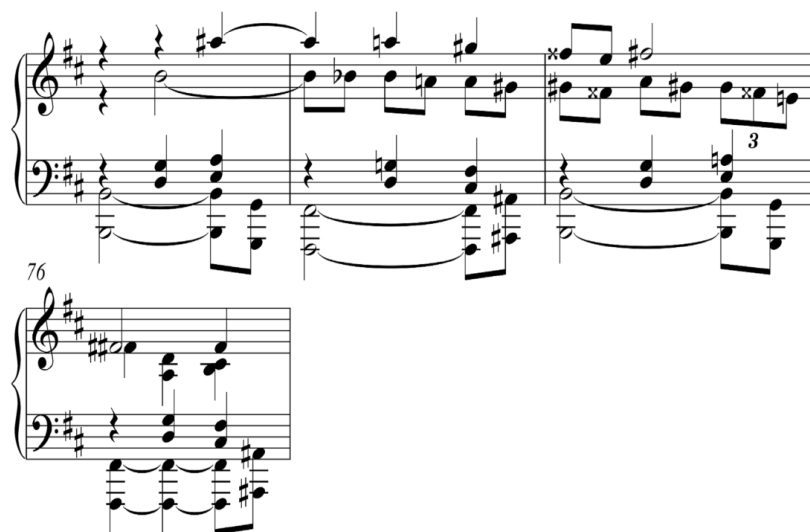
شکل ۹) استیناتو قسمت B از قطعه‌ی تغییر فا دیز به سی