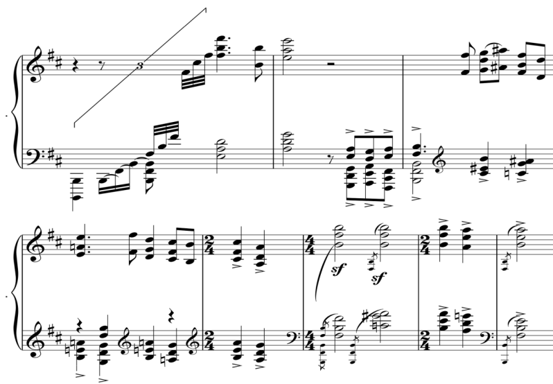
شکل ۲) میزان‌های ۸-۱۵

محوریت گرفتن نت «سی» و بکار شدن نت «می» و «لا» در میزان ۸، «نوا سی» را تداعی می‌کند. در صورت تبعیت از سیستم غربی، می‌توان بستر صوتی این گوشه را مطابق مینور، البته با انگاره‌های ملودیک و نیز تأکیدات متفاوت دانست. در میزان ۱۲ با آمدن نت «لا دیز»، خروج موقت به سمت اصفهان صورت می‌گیرد (شکل ۲).