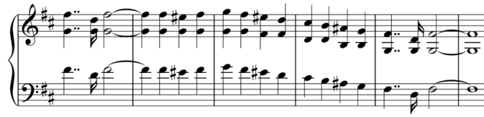
شکل ۶-الف) میزان‌های ۷-۱