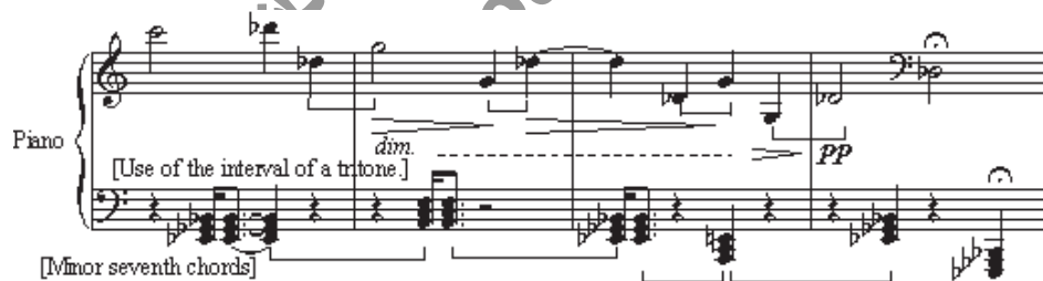
مثال ۱۳: بگتل شماره ۱۳، میزان‌های ۲۳ تا ۲۶

نمونه‌ای خوب از کاربرد غیرعملکردی ۶۰ آکورد هفتم کوچک را می‌توان در چهار میزان پایانی بگتل شماره‌ی ۱۳ (XIII) یافت. بارتوک دو فاصله‌ی هفتم کوچک را با یک فاصله‌ی تریاتون بر روی هم قرار می‌دهد که خود نشان دهنده‌ی کاربرد پنجم کاسته/چهارم افزوده به عنوان نوعی جایگزین برای دومینانت است. (مثال ۱۵) تریاتون، اکتاو را به دو نیمه‌ی متقارن تقسیم می‌کند. آنتوکولتز نشان می‌دهد که صداهای از یک مجموعه‌ی اکتاتونیک (هشت نتی) گرفته شده‌اند (می-بمل-می-سل-بمل-سل-لا-سی بمل-دو-ر بمل) (آنتوکولتز، ۱۹۸۴، ۷۸). با این آکوردها بیشتر به عنوان موتیف‌های هارمونیک برخوردار می‌شود تا شیوه‌ی معمول توالی آکوردها.