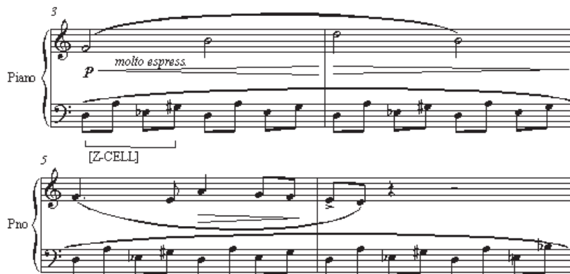
مثال ۲۰: ده قطعه‌ی آسان، شماره‌ی ۲، میزان‌های ۳ تا ۶

تتراکورد متقارن دیگری که در آهنگ دوم «ده قطعه‌ی آسان» استفاده شده است، «سلول-زی» ۱۳ نامیده می‌شود (اصطلاحی که آنتوکولتز به کار برد) که از دو فاصله‌ی نیم‌پرده که در فاصله‌ی چهارم درست از یکدیگر قرار گرفته‌اند، تشکیل شده است. در میزان‌های ۳ تا ۶، بارتوک یک ملودی «ر-دورین» را بر روی استیناتوی «سلول-زی (ر)» در کلید باس قرار می‌دهد.