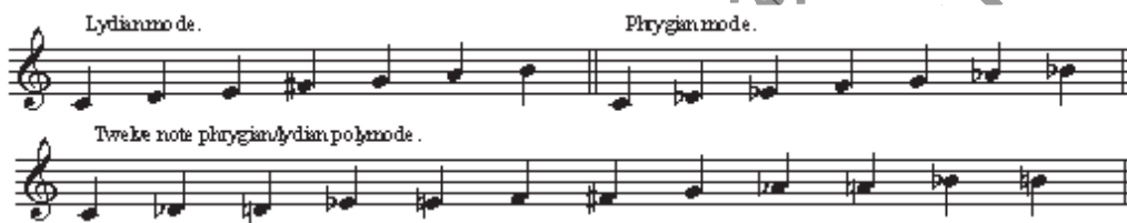
شکل ۲: ترکیب دو مد هفت نتی، برای خلق گام کروماتیک دوازده صدایی

یکی از مهمترین مفاهیم تفکر هارمونیک بارتوک، ایده‌ی «بای-مدالیت» ۲۱ یا «پلی-مدالیت» ۲۲ بود. او بر پایه‌ی یک صدای مشترک، مجموعه صداهای مختلفی را بر روی هم قرار می‌داد تا بتواند مد دیاتونیک پایه را گسترش دهد. در سخنرانی‌های هاروارد خود در سال ۱۹۴۵، بارتوک از ترکیب «فریژین/لیدین» برای خلق یک پلی مد دوازده صدایی از گام کروماتیک سخن گفت.