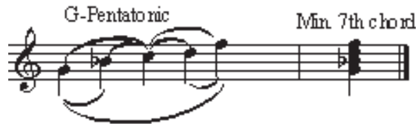
شکل ۶: گام پنتاتونیک مجار

با بیان قطعی خود که «تالیته‌ی آن یک دو ماژور خالص است»، بارتوک در برابر هر توضیح بای تنال از این قطعه مقاومت کرده است (بارتوک، ۱۹۴۵، ۴۳۳). به هر حال، چنین استفاده‌ای از مایه‌ی «دو-ماژور» نامتعارف است، چرا که تالیته به وسیله‌ی پیوند دو مجموعه صدای متفاوت بر اساس یک صدای پایه نشان داده شده است و همچنین صداهای کروماتیک به بهترین شکل به عنوان اجزای گوناگون مدهای مختلف دریافت می‌شوند. دلبستگی بارتوک به تقارن، به موسیقی محلی و روابط متقارن فواصل در گام پنتاتونیک و به تبع آن آکورد هفتم کوچک برمی‌گردد.