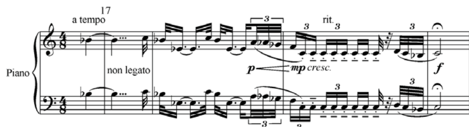
مثال ۱۲: هفت طرح اپوس ۹ ب، شماره‌ی ۲، میزان‌های ۱۷ تا ۲۰

این تناوب آکوردهای ماژور و مینور، اساس قطعه را تا میزان ۱۶ شکل می‌دهند. در اینجا بافت هم‌صدا با تأکید بر درجه‌ی هفتم بمل شده، نشانگر مد «دو-اٹولین» است. ساکف ۷۰ اشاره می‌کند که این میزان‌های پایانی، تغییری ناگهانی در تنالیت را نمایش می‌دهند. به طوری که از ادغام صداهای مدهای «دو-اٹولین» و «دو-لیدین» یک پلی مد جدید ساخته می‌شود (ساکف، ۱۹۹۳، ۱۴۰).