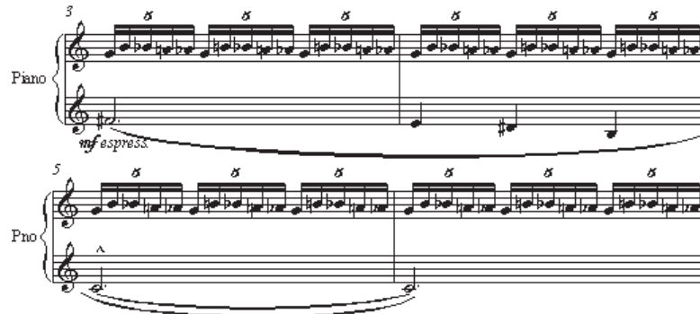
مثال ۱۴: چهارده بگتل، شماره ۲، میزان‌های ۳ تا ۶

صداهاى جدیدی در میزان ۱۲ (دودیز) و ۱۸ (ر) اضافه می‌شوند که همی ۱۲ صدای مجموعه نت‌های کروماتیک را کامل می‌کنند. استفاده از فاصله‌ی تریاتون (فادیز-دو) بر وجود زیرساخت مد لیدین تأکید می‌کند که خود به پلی مد دوازده صدایی دو لیدین/فریژین تعلق دارد. در نقاط کادانسی مهم قطعه نیز، با حرکت محسوس به تونیک برتنالیتیه‌ی دو ماژور تأکید شده است (بردل، ۲۰۰۱، ۶۶). در «تمرین انگشت» (ده قطعه‌ی آسان شماره ۹) بارتوک از فیگور استیناتوی مشابهی بر اساس گام تمام‌پرده استفاده کرده است.