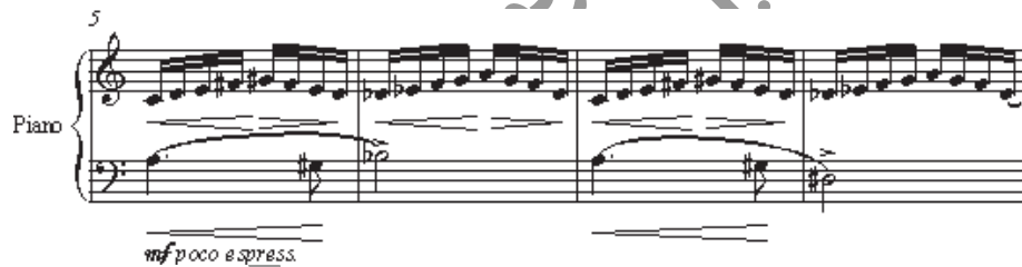
مثال ۱۵: ده قطعه‌ی آسان، شماره ۹، میزان‌های ۵ تا ۸

صداهاى جدیدی در میزان ۱۲ (دودیز) و ۱۸ (ر) اضافه می‌شوند که همی ۱۲ صدای مجموعه نت‌های کروماتیک را کامل می‌کنند. استفاده از فاصله‌ی تریاتون (فادیز-دو) بر وجود زیرساخت مد لیدین تأکید می‌کند که خود به پلی مد دوازده صدایی دو لیدین/فریژین تعلق دارد. در نقاط کادانسی مهم قطعه نیز، با حرکت محسوس به تونیک برتنالیتیه‌ی دو ماژور تأکید شده است (بردل، ۲۰۰۱، ۶۶). در «تمرین انگشت» (ده قطعه‌ی آسان شماره ۹) بارتوک از فیگور استیناتوی مشابهی بر اساس گام تمام‌پرده استفاده کرده است.