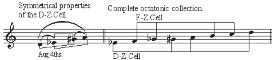
شکل ۷: ترکیب دو سلول زی و تشکیل مجموعه‌ی اکتاتونیک

در میزان‌های ۷ تا ۹، یک انتقال به «سلول - زی فا» انجام می‌گیرد و می‌توان نشان داد که «سلول-زی ر» و «سلول-زی فا» به خاطر ریشه‌ی مشترک‌شان در گام اکتاتونیک، با یکدیگر پیوند دارند. این قطعه نمونه‌ای خوب از روش بارتوک در ترکیب مجموعه‌های مدال، کروماتیک و اکتاتونیک که همگی از پلی مد لیدین/فریژین می‌آیند، است.