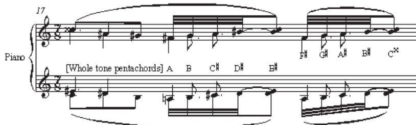
مثال ۱۸: هفت طرح، اپوس ۹ ب، شماره‌ی ۷، میزان ۱۷

کاربردی مشابه از گام پرده را می‌توان در قطعه‌ی هفتم از «هفت طرح» یافت. در نیمه‌ی دوم این قطعه، دو پنتاکورد تمام‌پرده‌ی «لا-می دیز» و «فادیز-دودوبل دیز» با حرکتی موازی و در فاصله‌ی ششم بزرگ از یکدیگر بر روی هم سوار شده‌اند (میزان‌های ۱۷ تا ۲۲).