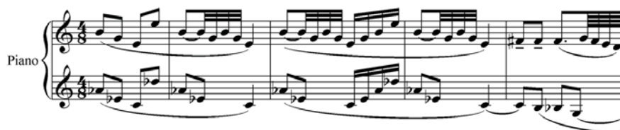
مثال ۱۱: هفت طرح، اپوس ۹ ب، شماره‌ی ۲، میزان‌های ۱ تا ۵

رویکرد بارتوک به پلی مدالیت، به خوبی در قطعه‌ی دوم از «هفت طرح»، اپوس 9-b نیز مشهود است. در میزان‌های ۱ تا ۴، تریاد «می مینور» در دست راست، هم‌زمان بر روی تتراکورد «لابمل ماژور» در دست چپ شنیده می‌شود.